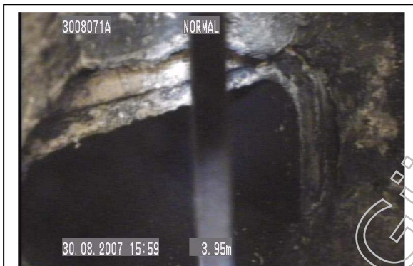
Nr. 3 Beschädigung des Innenrohres beim Abgasrohranschluss 3,95 m von dem oberen Reinigungsverschluss nach unten aus gesehen