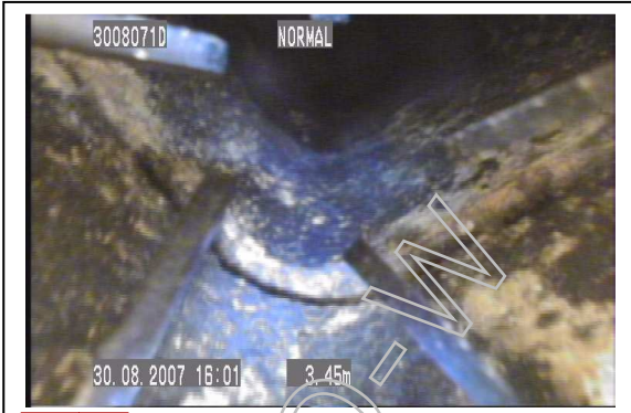
Nr. 2 Beschädigung Innenrohr: 3,45 m von dem oberen Reinigungsverschluss nach unten aus gesehen