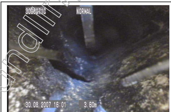
Nr. 3 Beschädigung des Innenrohres beim Abgasrohranschluss 3,60 m von dem oberen Reinigungsverschluss nach unten aus gesehen