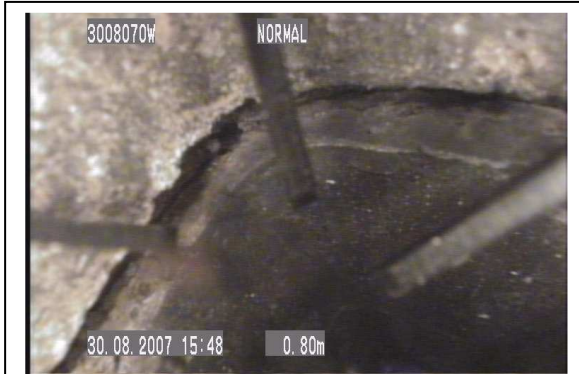
Nr. 1 Beschädigung Innenrohr: 0,80 m von dem oberen Reinigungsverschluss nach oben aus gesehen